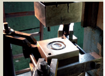
Prägewerkzeug zur Prägung des Deckels.