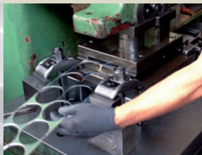
Stanzen der Platine.