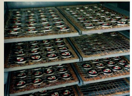
Einbrennen des Wappens.