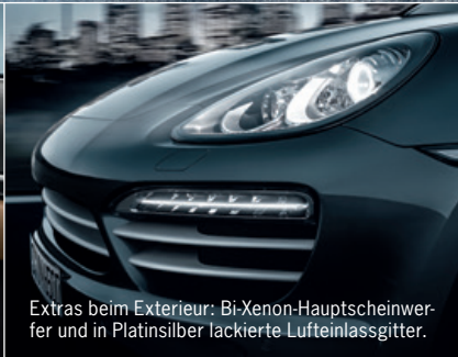
Extras beim Exterieur: Bi-Xenon-Hauptscheinwerfer und in Platinsilber lackierte Lufteinlassgitter.