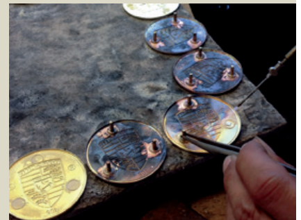
Hartlöten der Stifte nach Ausstanzen der Platine.