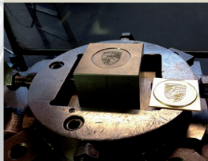
Prägewerkzeug zur Prägung in die Platine.