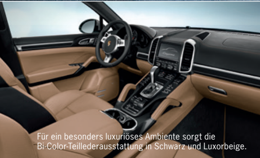
Für ein besonders luxuriöses Ambiente sorgt die Bi-Color-Teillederausstattung in Schwarz und Luxorbeige.