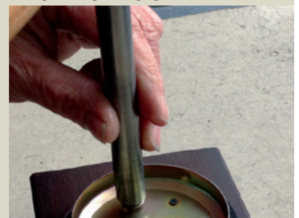
Zusammenbau der Einzelteile durch Anbringen der Federmuttern.