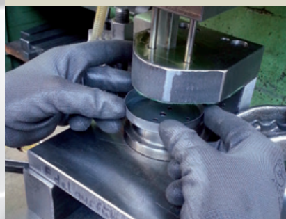
Lochen und Stempeln des Halters.