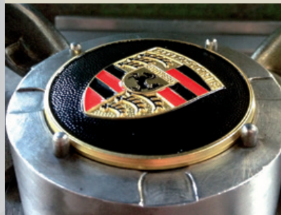
Wölben des zuvor farbig ausgelegten Porsche Wappens.