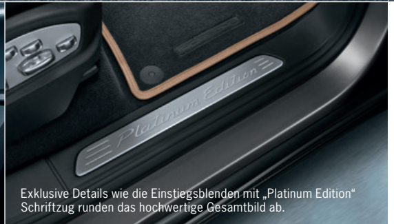
Exklusive Details wie die Einstiegsblenden mit „Platinum Edition“ Schriftzug runden das hochwertige Gesamtbild ab.